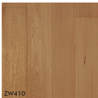
ZW410 Oak Natur