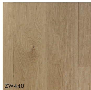
ZW440 Oak Invisible