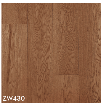
ZW430 Oak Caramel